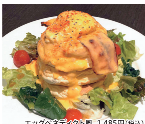
エッグベネディクト風 1,485円(税込)

住 宝塚市武庫川町2-10 NTTビル1F 電 0797-86-1111 営 11:00~18:00 休 水曜(但し祝日の場合は営業)・年末年始