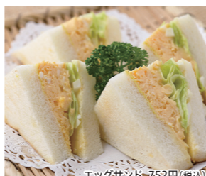
エッグサンド 752円(税込)

住 宝塚市栄町1-6 花のみちセルカ 2番館2F 電 0797-85-1200 営 9:00~17:00(L.O16:30) 休 水曜