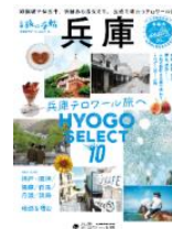
◀別冊旅の手帖「兵庫」

発売日 2023年6月26日(月) 価格 922円(税込) 様式 132ページ(A4変型判)