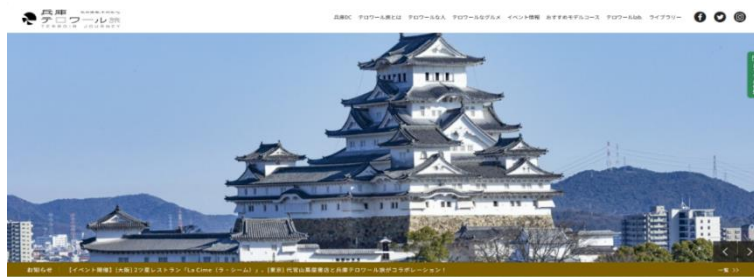
▲「兵庫テロワール旅」サイト TOPページ