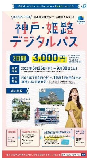
▲(ICOCAでGO)神戸・姫路デジタルパス