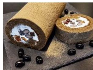
▲丹波黒豆のほうじ茶ロール