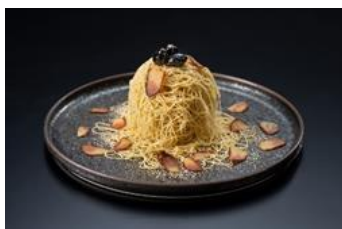
▲生搾りモンブラン～栗×丹波黒豆～