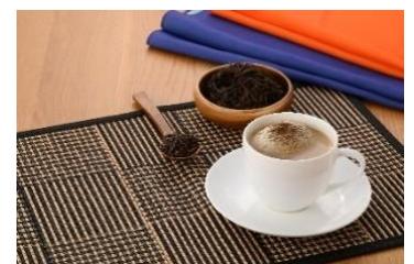
▲丹波篠山焙じ茶ミルク珈琲