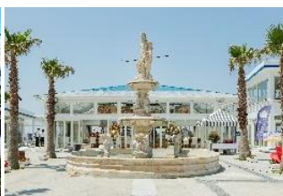
▲淡路島クラフトサーカス