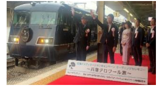
▲セレモニーの様子

運行区間 往路:姫路駅→(JR神戸線・福知山線・山陰本線)→城崎温泉駅 復路:城崎温泉駅→(山陰本線・福知山線・JR神戸線)→大阪駅