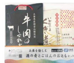
▲兵庫を愉しむ酒の肴とごはんのおともセット