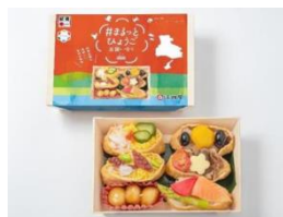
◀淡路屋 「#まるっとひょうご 五国いなり」

兵庫県内老舗弁当製造事業者と兵庫県内の大学生とともに開発に取り組んできたオリジナル弁当、兵庫DC特製「DC テロワール弁当」を発売しました。