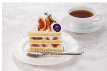
▲いちじくのプレミアムショートケーキ

実施箇所 ホテルグランヴィア京都、ホテルグランヴィア大阪、ホテルグランヴィア和歌山、ホテルグランヴィア岡山、ホテルグランヴィア広島、ホテルヴィスキオ大阪、ホテルヴィスキオ尼崎、奈良ホテル、梅小路ホテル京都