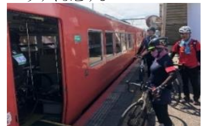
▲サイクリストが列車に乗車