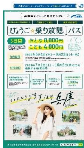
▲ひょうご☆乗り放題パス