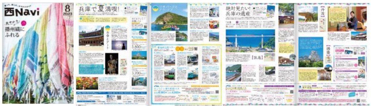
▲JR 西日本のおでかけ情報誌「西Navi」6月～9月号

JR 西日本のおでかけ情報誌「西Navi」、東海道・山陽新幹線車内搭載誌「ひととき」、JR 西日本提供番組「おとな旅あるき旅」、ジパング倶楽部会員誌など、各種媒体にてプロモーションを行いました。