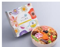
◀まねき食品 「兵庫の味力 まるっとちらし寿司 ミルベルフルール」