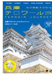
◀兵庫DC公式 イベントガイドブック

発行日 2023年5月23日(火) 発行部数 52万部 様式 A4冊子、36ページ、オールカラー 配布先 JR6社全国主要駅、空港(神戸、伊丹)、道の駅、兵庫県内市町、観光協会、宿泊施設等