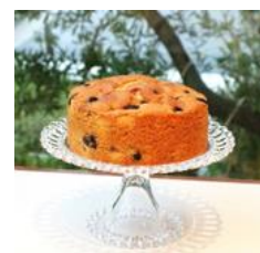
▲兵庫バターケーキ