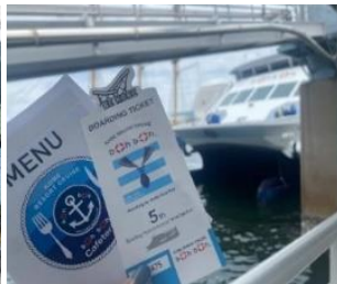
▲ boh boh KOBE