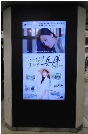
▲いただきます夏休み兵庫