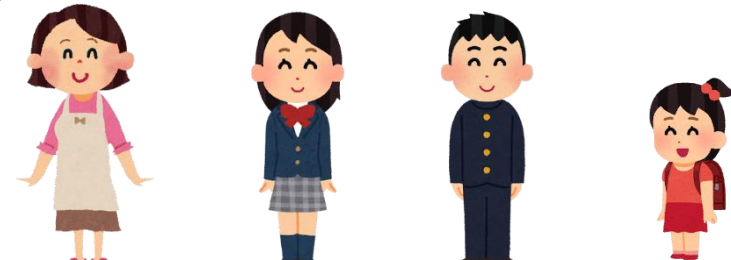
母(未接種) 高校生(未接種) 中学生(未接種) 小学生(接種不可)