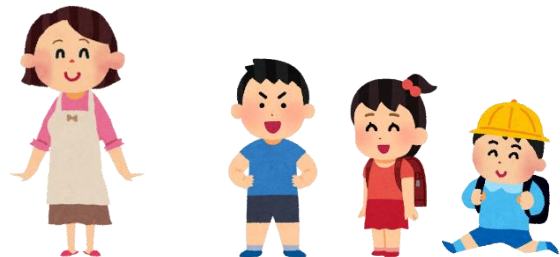
母(未接種) 小学生の子供3人 (接種不可)