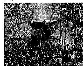
最優秀賞「灘祭り神輿合わせ」