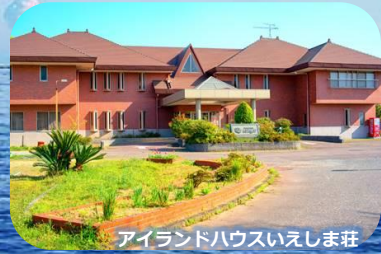
アイランドハウスいえしま荘