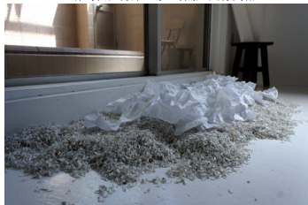
八上桐子《鳩の春》2022