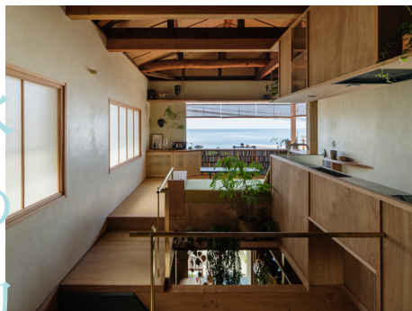
林崎松江海岸の家

建物それ自体を「川柳」という言葉を通して捉え直すことで、空間の性質は変化し、新たな空間として生まれ変わります。「建築」と「川柳」という、一見交わることのない2つが出会う空間をぜひ体験ください。