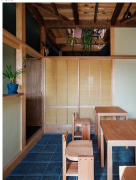
林崎松江海岸の家