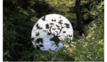
左から さとうりさ《こはち》、WAlmoto."Motoka Watanabe"《黄色い双眼鏡の探検》、高橋瑠璃《2人の秘密の間を過ごす》、船井美佐《森を覗く山の穴》