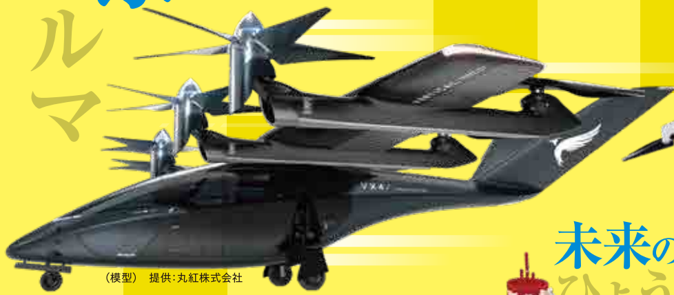
(模型) 提供:丸紅株式会社