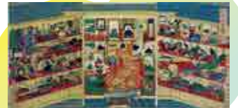
湯島聖堂博覧会(文部省博覧会)1872年 古今珍物集覧 元昌平坂聖堂ニ於テ 三枚続