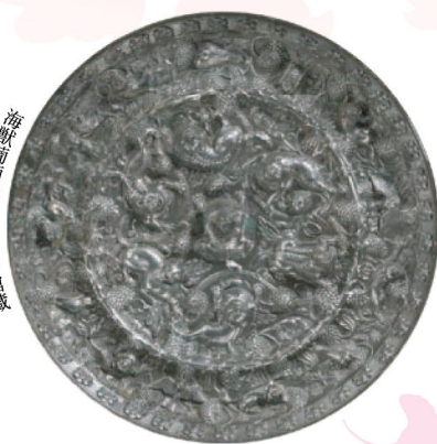
海獸葡萄鏡 唐 当館蔵