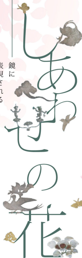
鏡に 表現される 植物たち