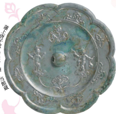
蓮上唐子紋八花鏡 唐 当館蔵

銅鏡の背面には、様々な紋様が表されています。その中で植物を表現した紋様は、戦国時代（紀元前5〜3世紀）頃に登場します。そして、隋唐時代（紀元後6〜8世紀）には、西アジアに由来する植物をモチーフとした紋様が採用され、流行します。そこに表現される植物は単に美を象徴するだけでなく、豊かさを象徴するなど鏡の所有者に幸福をもたらす意味が強く込められています。 本展では、花と緑に溢れる季節にあわせ、当館が所蔵する銅鏡の中から、植物の紋様のある作品を取上げ、表現された植物とその文化について紹介します。