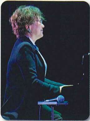
菊池 ひみこ ピアノ

仙台市出身。7歳よりクラシックピアノを始め、パイプオルガン、作曲を学び、16歳でヤマハ・エレクトーン・コンクールに優勝。その後、世界各地を演奏旅行し、帰国後、プロのピアニストとして活動を始める。1975年「モントルー・ジャズ・フェスティバル」に出演。1980年以降、オリジナルアルバムを次々と発表。「菊池ひみこバンド」で海外を含む各地のジャズ・フェスティバルやライブハウス等での演奏活動も展開。また、数々のCM音楽やTV音楽、映画音楽など、作、編曲家としての仕事も多数。2019年には自己のグループで、「デトロイト・ジャズフェスティバル」(DJF)に出演。2022年にも、デトロイトジャズオールスターズと共に再度DJFに出演。それに先駆け、ニューヨーク公演も行った。