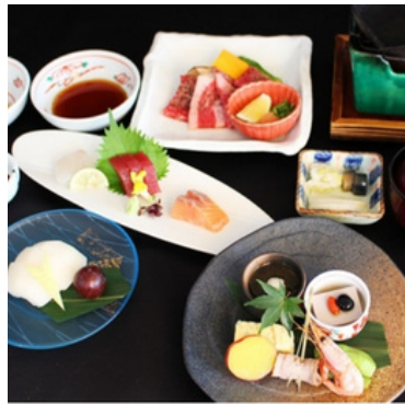
国産牛陶板焼き膳 ランチ