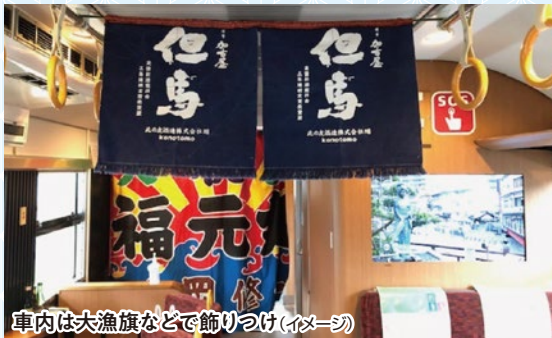
車内は大漁旗などで飾りつけ(イメージ)