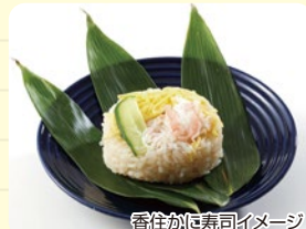
香住かに寿司イメージ